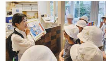
渋谷区の小学生がTENOHHA代官山の環境取り組みを見学

次の世代、さらにその先の世代を見据え、誰もが自分らしく、いきいきと輝ける未来をめざし社会課題の解決に取り組んでいます。各事業会社における若手従業員への施策のほか、学生情報センターにおける学生へのさまざまなキャリア支援活動、事業地域での環境教育支援など、企業と社会のサステナブルな成長を担う世代とのエンゲージメントを積極的に行っています。