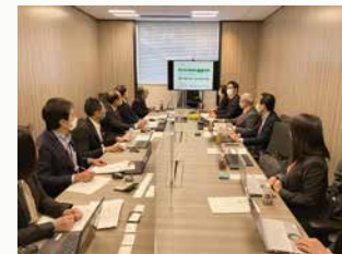
戸田建設(株)とのエンゲージメントの様子

取引先・パートナーとともに協業して共創価値を追求し、自社のみならずサプライチェーン全体で企業価値向上と成長、持続可能な社会の実現をめざしています。協力会社との合同安全大会の開催をはじめ、サステナブル調達方針の周知や、人権・環境などの社会課題についての情報交換を行うなど、事業を通じたサプライヤーエンゲージメントを実施しています。