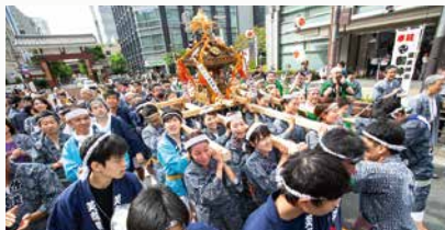
東急不動産が参画する(一社)竹芝エリアマネジメントでは「だらだら祭り」に参加

企業の社会的責任を果たすため公益を追求し、事業活動を通じて地域活性化や豊かな環境の形成に取り組み、持続可能な社会に貢献します。清掃活動や防災訓練、祭りへの参加や小学校への出前授業などエリアマネジメント活動を行うほか、地区協議会などに参加し、地域の課題に対する解決を図り、エリアの価値向上や経済効果の創出に寄与しています。