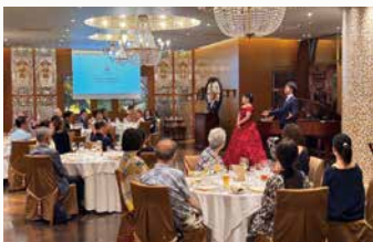
東急こすもす会会員様限定イベント「演出家 宮本亞門氏と触れる名作オペラ『蝶々夫人』」 2024年7月4日実施(15組30名様ご招待)

徹底したお客さま志向を追求し、誠実な企業活動と安心・安全な商品・サービスを提供しています。会員数約14万人の「東急こすもす会」※では、各種サービスで日常の接点を持ちつつ、購入時特典を提供することで、再契約を促進する活動を行っています。また、各種営業活動を通じたアンケートや、オフィスビル事業におけるテナントさまへのフリーペーパーの発行、節電・節水の呼びかけなどの環境啓発にも取り組んでいます。