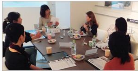
グループインタビュー

そこで得られたさまざまな声からお客さまのニーズを把握し、「BRANZ」が持つ知見と総合力による独自の視点で具体化。「暮らしを高める機能美」をコンセプトに、オリジナル商品企画「MEUP（ミアップ）」として開発を進めています。これまで、お客さまから特に声が多かった水回りの調査から、MEUPで開発した、オリジナルのキッチン・洗面化粧室・浴室を物件に導入し商品化しています。