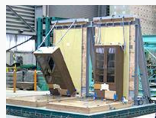
振動台実験の様子

地震時の家具転倒防止のため、振動台実験を行い、間仕切壁などを家具転倒防止金具取付用補強仕様とし、家具の金具固定の際に十分な壁の強度設定としています。