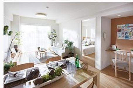
「ルジェンテ・リベル志木」モデルルーム

東急リバブル（株）は2015年9月に、「子育て家族のシアワセ創造」をコンセプトにしたリノベーションマンション「ルジェンテ・リベル志木」のモデルルームをオープンしました。専有部には、子育て家族が快適に安心して暮らせる、お子さまの将来を考えた間取り計画「子育て応援プラン」を用意しました。同プランを採用した住宅では、子どもや子育て家族が快適に安心して暮らせるよう、専有部、共用部、管理体制から立地環境、周辺環境に至るまで、専属の認定士によるチェックを受け、ミキハウス子育て総研の「子育てにやさしい住まいと環境」認定を取得しています。