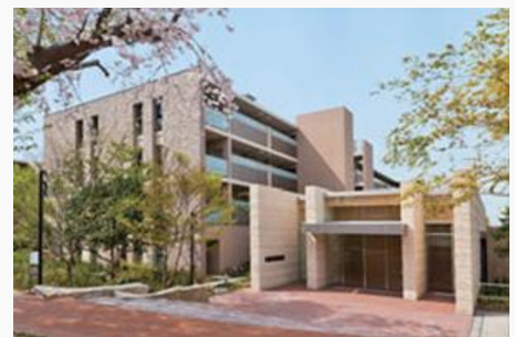
ブルンズシティ世田谷中町（分譲マンション）