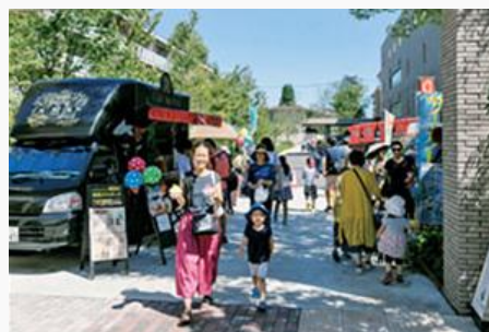
世田谷中町まつり（緑日の様子）