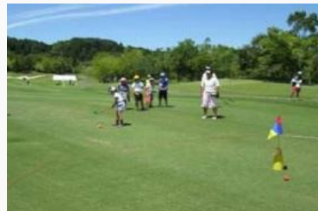
ゴルフレッスンの様子