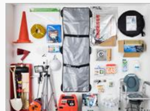
備蓄倉庫備品の一例

東急不動産（株）の分譲マンション「BRANZ」は、業界に先駆けて備蓄倉庫の分散配置を標準化するなど、これまで防災対策に積極的に取り組んできました。さらに建物構造の強化や備蓄物の整備、管理組合単位の防災活動への備えなどを包括的に整備するとともに、入居者の防災の意識と知識の向上を図り、防災への取り組みを強化しています。