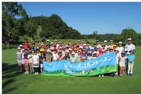
大多喜城ゴルフ倶楽部

東急不動産（株）と（株）東急リゾートサービスは、子どもたちの健全な身体づくりやゴルフ技術・マナーの向上などを目的に、小学生を対象とした「夏休みジュニアゴルフレッスン」を開催しています。夏休みに実施する小学生を対象とした当レッスンイベントは、2019年で12回目を迎え、これまでに約800名以上もの方にご参加いただき、ジュニアゴルファーの裾野拡大と将来有望なゴルファーの育成の場として実施してきました。2019年は8月に大多喜城ゴルフ倶楽部(千葉県)で開催しました。(写真は2018年の様子)