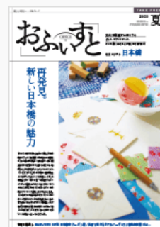
フリーペーパー「おふいすと」

東急不動産（株）は、運営するビルのオフィスワーカーの方に、充実したオフィスライフを過ごしていただくため、フリーペーパー「おふいすと」を発行しています。また、（株）イーウェルと提携して、東急不動産グループ独自の優待情報をご利用いただける入居テナントさま専用ウェブサイト「おふいすとCLUB」を提供し、ご好評いただいています。