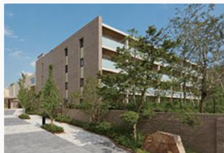
グランクレール世田谷中町（シニア住宅）