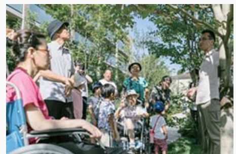
世田谷中町まつり（タウン内散策の様子）