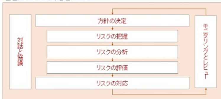
当社グループのリスク管理プロセス

当社は、財務的損失、ブランドイメージの失墜、事業継続の中断・停止等、その経営に悪影響を与える内部・外部要因のすべてをリスクとして認識したうえで、それらを統括的に管理するために、全社の重大リスクを把握し、対策の実施等を優先度に応じて計画的かつ継続的に行っています。また、グループ各社に対し当該リスクを評価・分析したうえでこれを管理させています。