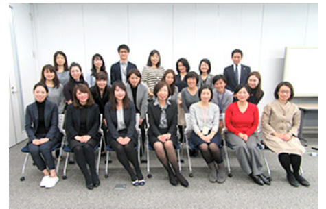
「ポジティブ・ネットワーキング・カレッジ」開催風景

当社グループは、女性の活躍を推進するため、グループ横断的なネットワークを形成し、取り組みを進めています。女性活躍をテーマとした「ポジティブ・ネットワーキング・カレッジ」はグループ従業員の誰もが参加可能な交流の場であり、女性を中心に各社から従業員が参加し、課題解決に向けて話し合いを行っています。