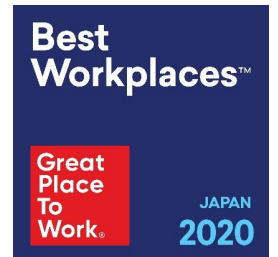
「Great Place to Work®」 ロゴマーク

東急リバブル（株）は世界約60カ国で展開している世界最大級の意識調査機関 Great Place to Work®が実施する「働きがいのある会社」ランキング2020年度日本版において25位にランクインしました。このランキングは従業員へのアンケートと企業文化や会社方針、人事制度に関する会社への意識調査を基に選出され、選出企業は優良企業としてグローバルで高い評価を得ています。