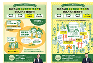
ダイバーシティ キャンペーンポスター