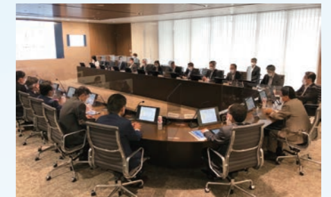
サステナビリティ委員会の様子