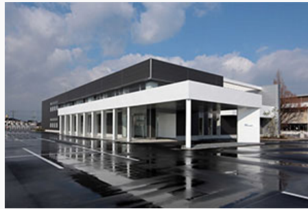
米子オペレーションセンター（鳥取県米子市）