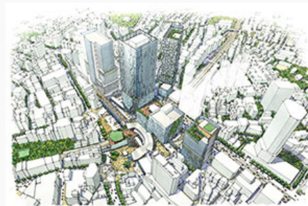
渋谷駅周辺地区の再開発の完成イメージ

国内屈指のターミナルである渋谷は、交通面のみならず情報・文化面でも地域のハブ的な機能を担ってきました。現在、渋谷の都市機能を根本から見直す取り組みが官民一体で進められており、東急不動産（株）は、この再開発プロジェクトに参画しています。クリエイティブ・コンテンツ産業や都市型観光の拠点としての機能を高め、すべての再開発事業が完了する2027年には渋谷は、国内外からさらに多くの人々をひきつける街へと変貌を遂げる予定です。