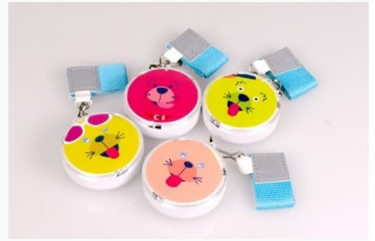
キューズモールオリジナル防犯ブザー

また、「地元の子どもたちにも、もっとスポーツの素晴らしさを感じて欲しい！」との声を受け、施設周辺の小学校に『体育用品』を寄贈するなど、地域の活性化に繋がる様々な企画を実施しています。