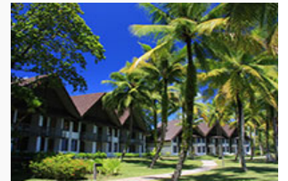
パラオ・パシフィック・リゾート

東急不動産（株）では、約30年にわたる「パラオ・パシフィック・リゾート」の経営を通じて、環境保全、文化継承、雇用創出、インフラ整備などに取り組んでいます。「パラオ・パシフィック・リゾート」の全従業員の8割以上はパラオ人を採用し、観光立国であるパラオにおいて、雇用機会の創出とホテル業界の人材の育成など、現地社会に貢献しています。