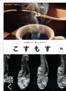
会員情報誌「こすもす」

当社グループでは、商品のご購入後やサービスをご利用いただいた後も継続してお客さまの豊かで快適な暮らしのお手伝いをさせていただくため、会員組織「東急こすもす会」を運営しています。7万人を超える「東急こすもす会」会員の皆さまと、会員情報誌「こすもす」や会員専用ウェブサイト「こすもすweb」を通して、コミュニケーションを深めています。