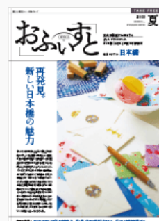
フリーペーパー「おふいすと」

東急不動産（株）は、運営するビルのオフィスワーカーの方に、充実したオフィスライフを過ごしていただくため、フリーペーパー「おふいすと」を発行しています。また、（株）イーウェルと提携して、東急不動産グループ独自の優待情報をご利用いただける入居テナントさま専用ウェブサイト「おふいすとCLUB」を提供し、ご好評いただいています。