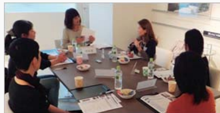
グループインタビュー

そこで得られたさまざまな声からお客さまのニーズを把握し、「BRANZ」が持つ知見と総合力による独自の視点で具体化。“暮らしを高める機能美”をコンセプトに、オリジナル商品企画「MEUP（ミアップ）」として開発を進めています。これまで、お客さまから特に声が多かった水回りの調査から、MEUPで開発した、オリジナルのキッチン・洗面化粧室・浴室を物件に導入し商品化しています。