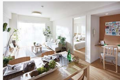
「ルジェンテ・リベル志木」モデルルーム

東急リバブル（株）は2015年9月に、「子育て家族のシアワセ創造」をコンセプトにしたリノベーションマンション「ルジェンテ・リベル志木」のモデルルームをオープンしました。専有部には、子育て家族が快適に安心して暮らせる、お子さまの将来を考えた間取り計画「子育て応援プラン」を用意しました。同プランを採用した住宅では、子どもや子育て家族が快適に安心して暮らせるよう、専有部、共用部、管理体制から立地環境、周辺環境に至るまで、専属の認定士によるチェックを受け、ミキハウス子育て総研の「子育てにやさしい住まいと環境」認定を取得しています。