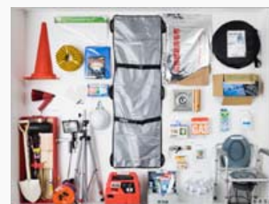
備蓄倉庫備品の一例

東急不動産（株）の分譲マンション「BRANZ」は、業界に先駆けて備蓄倉庫の分散配置を標準化するなど、これまで防災対策に積極的に取り組んできました。さらに建物構造の強化や備蓄物の整備、管理組合単位の防災活動への備えなどを包括的に整備するとともに、入居者の防災の意識と知識の向上を図り、防災への取り組みを強化しています。