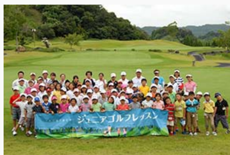
大多喜城ゴルフ倶楽部

東急不動産（株）と（株）東急リゾートサービスは、子どもたちの健全な身体づくりやゴルフ技術・マナーの向上などを目的に、小学生を対象とした「夏休みジュニアゴルフレッスン」を開催しています。2015年度は8月に大多喜城ゴルフ倶楽部(千葉)で開催し、親子ペア26組・子ども51人がプロのレッスンを受け、ゴルフを体験しました。