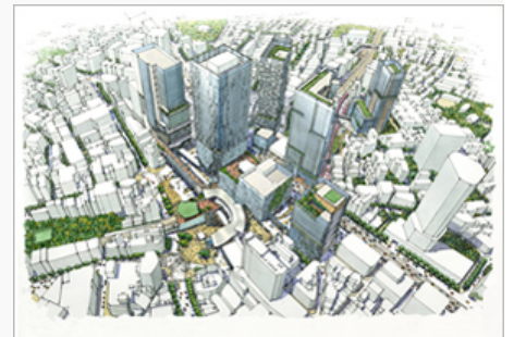
渋谷駅周辺地区の再開発の完成イメージ

国内屈指のターミナルである渋谷は、交通面のみならず情報・文化面でも地域のハブ的な機能を担ってきました。現在、渋谷の都市機能を根本から見直す取り組みが官民一体で進められており、東急不動産（株）は、この再開発プロジェクトに参画しています。クリエイティブ・コンテンツ産業や都市型観光の拠点としての機能を高め、すべての再開発事業が完了する2027年には渋谷は、国内外からさらに多くの人々をひきつける街へと変貌を遂げる予定です。