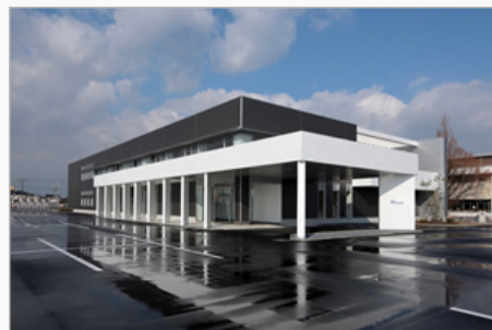
米子オペレーションセンター(鳥取県米子市)

2015年2月に操業を開始した「米子オペレーションセンター」では、5年間で約300人の地元採用を計画しており、地元の雇用創出に貢献しています。