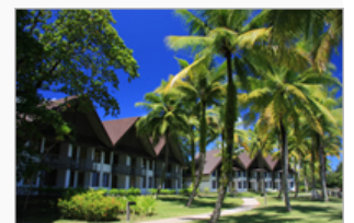
パラオ・パシフィック・リゾート

東急不動産(株)では、約30年にわたる「パラオ・パシフィック・リゾート」の経営を通じて、環境保全、文化継承、雇用創出、インフラ整備などに取り組んでいます。「パラオ・パシフィック・リゾート」の全従業員の8割以上はパラオ人を採用し、観光立国であるパラオにおいて、雇用機会の創出とホテル業界の人材の育成など、現地社会に貢献しています。